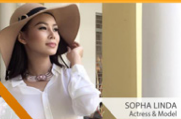
SOPHA LINDA Actress & Model