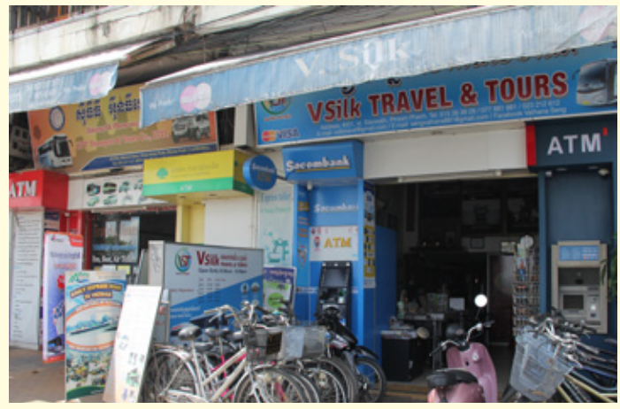
ម៉ាស៊ីន ATM មាត់ទន្លេចតុមុខ (អាសយដ្ឋានផ្ទះលេខ ២២១ ផ្លូវស៊ីសុវត្ថិ សង្កាត់ផ្សារកណ្តាលទី ១ ខណ្ឌដូនពេញ រាជធានីភ្នំពេញ)។ ATM បờ sông Chaktomuk (địa chỉ: #221, St. Sisowath, Sangkat Phsar Kandal 1, Khan Daun Penh, Phnom Penh).

Nhằm tạo điều kiện phục vụ khách hàng một cách tốt nhất, Sacombank Campuchia đã lắp đặt thêm máy ATM tại khu bờ sông Chaktomuk và máy ATM Tuol Kork Domino Pizza - nơi tập trung khách du lịch trong nước và nước ngoài.