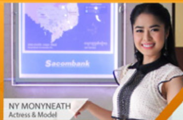
NY MONYNEATH Actress & Model