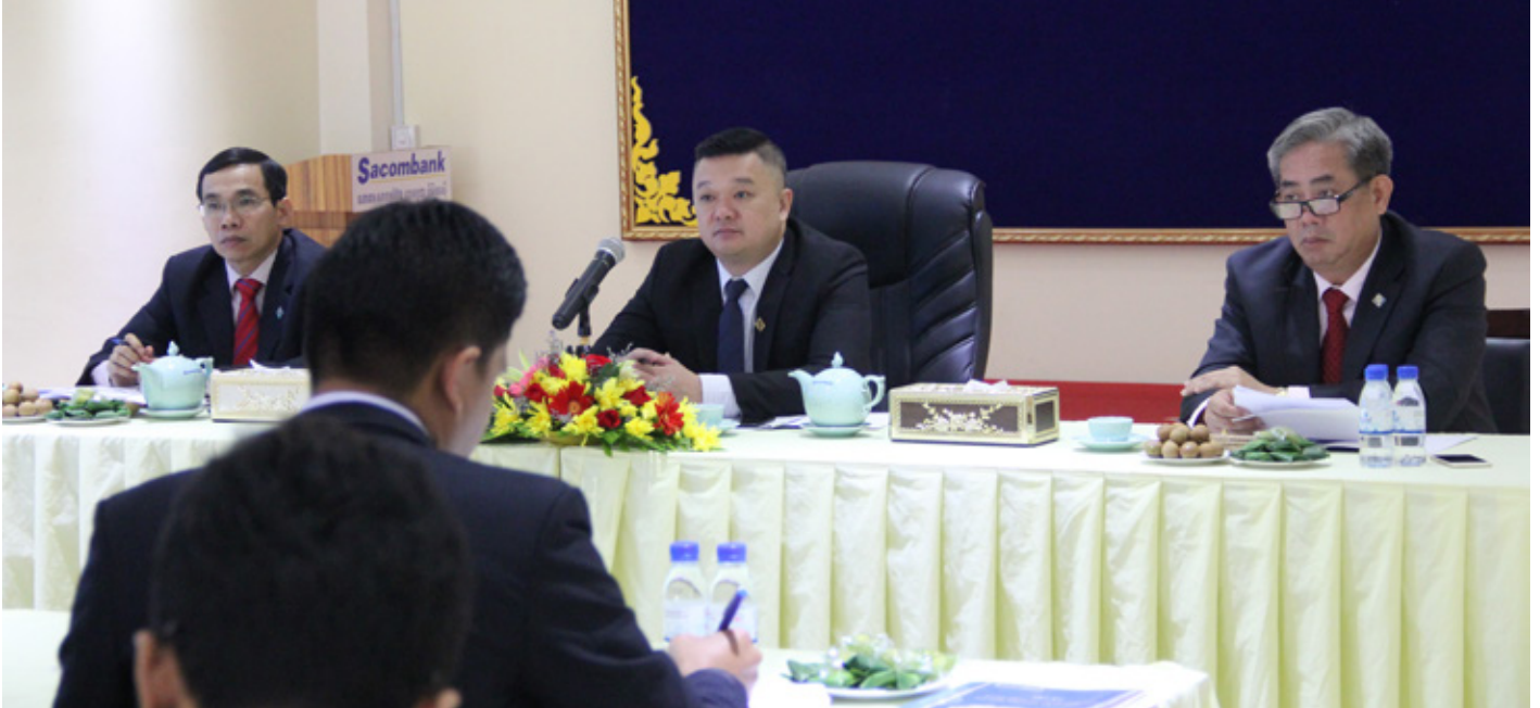
កិច្ចប្រជុំរវាងក្រុមប្រឹក្សាភិបាលជាមួយថ្នាក់គ្រប់គ្រងរបស់ធនាគារ សាខាម៉ែឺង ខេមបូឌា នាថ្ងៃទី ១៤ ខែ កញ្ញា ឆ្នាំ ២០១៧ នៅទីស្នាក់ការកណ្តាលធនាគារ សាខាម៉ែឺង ខេមបូឌា។

HĐQT Sacombank Campuchia tham dự buổi họp với cán bộ quản lý vào ngày 14/09/2017 tại hội sở Sacombank Campuchia.