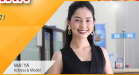
MAI YA Actress & Model