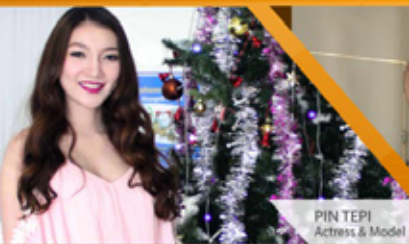
PIN TEPI Actress & Model