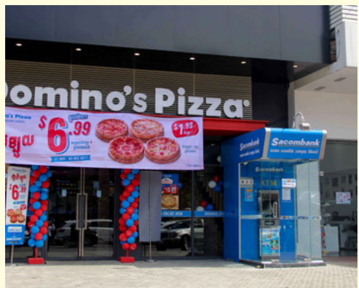
ម៉ាស៊ីន ATM ទួលគោក Domino Pizza (អាសយដ្ឋានផ្ទះលេខ ១០១A1 & ១០១A2 ផ្លូវ ៥១៦ កែង ៣១៥ សង្កាត់បឹងកក់ទី ១ ខណ្ឌទួលគោក រាជធានីភ្នំពេញ)។ ATM Tuol Kork Domino Pizza (địa chỉ: # 101A1 & 101A2, đường 516 góc ngã tư đường 315, Sangkat Beoung Kok 1, Khan Tuol Kork, Phnom Penh).