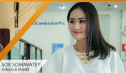
SOK SOMAVATEY Actress & Model