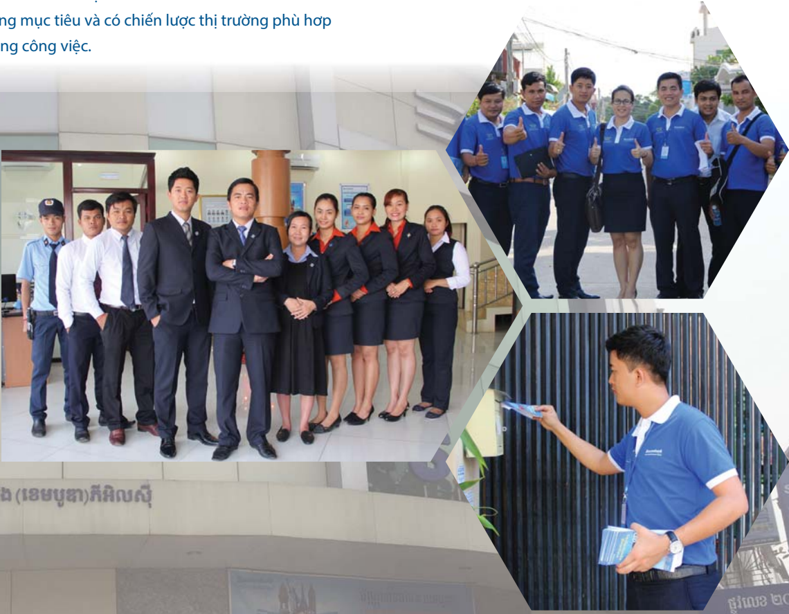
ធនាគារ សាខាមប៊ែង (ខេមបូឌា) ភីអិលស៊ី សាខា ពោធិ៍ចិនតុង